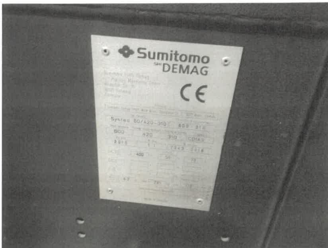
Zdj. 2. Tabliczka znamionowa