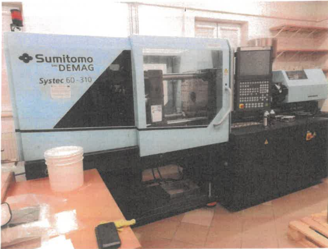
Zdj. 1. widok ogólny