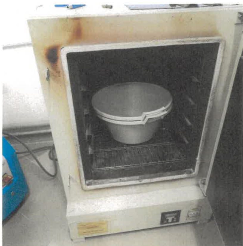
Zdj. 1. widok ogólny