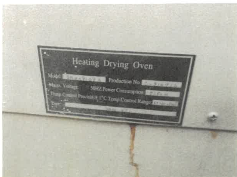
Zdj. 2. Tabliczka znamionowa