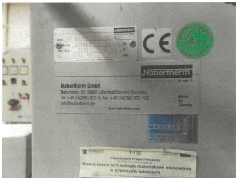
Zdj. 2. Tabliczka znamionowa