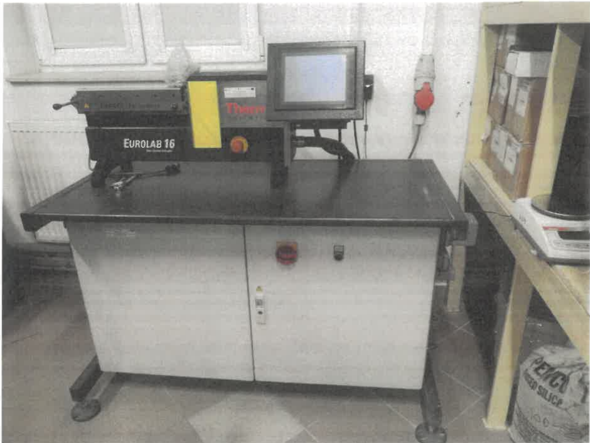
Zdj. 1. widok ogólny