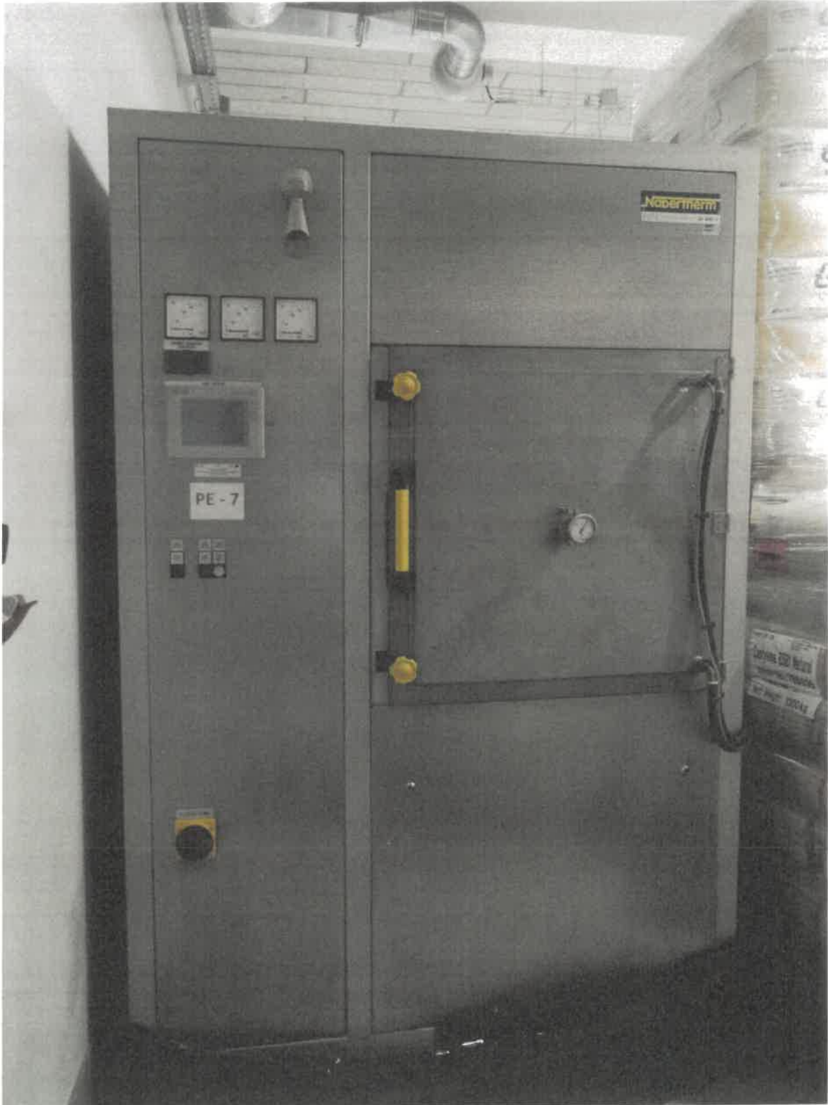
Zdj. 1. widok ogólny