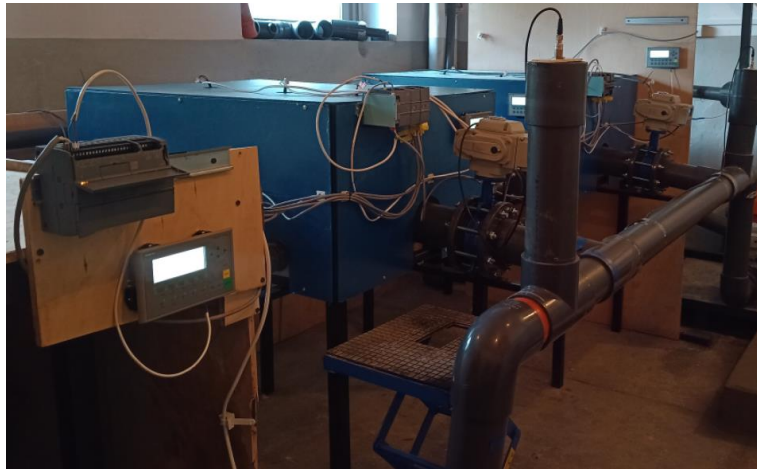
Rys. 1. Prototyp rozwiązania

umożliwiający symulację warunków operacyjnych oraz niezależną prezentację możliwości systemu.