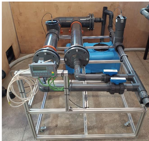
Rys. 3. Demonstrator zbiornika grawitacyjno-pompowego

Opracowanie koncepcji i wykonanie prototypu zbiornika grawitacyjno-pompowego (rys. 3) umożliwiło przeprowadzenie szczegółowych analiz hydraulicznych w warunkach laboratoryjnych.